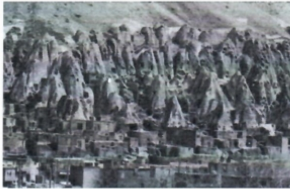
شکل ۱. بامیان، معماری صخره‌ای